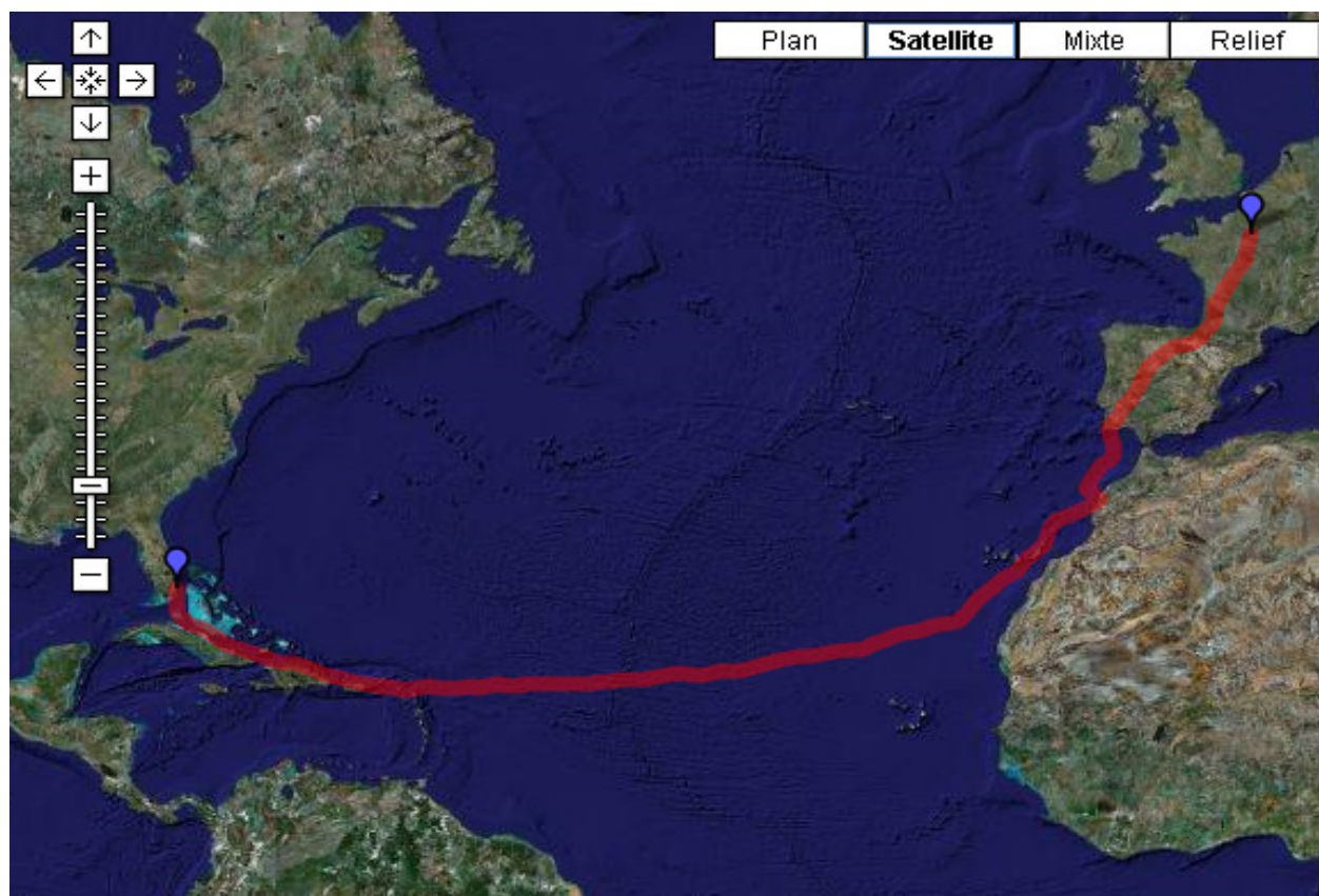
Trace générée par Sierra Echo