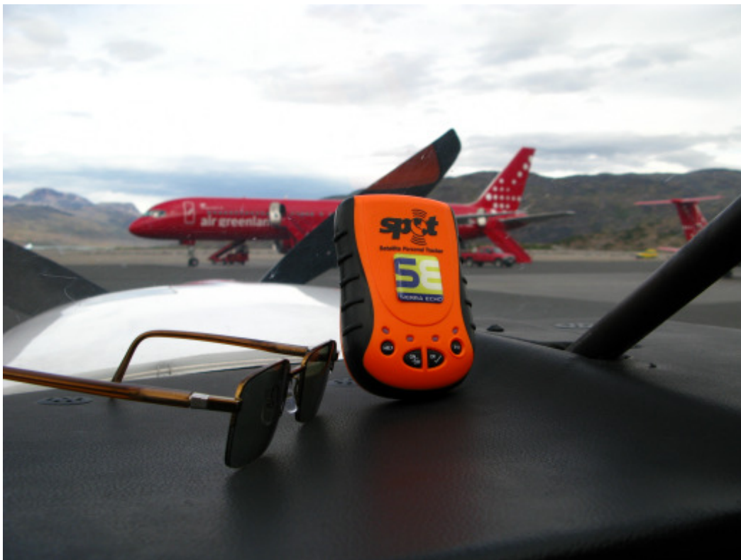
La balise Spot sous la verrière du Mooney